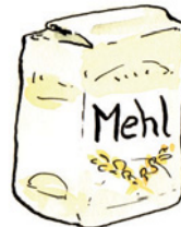
das Mehl Mehl Nomen