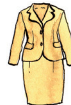
das Kostüm Kos-tüm Nomen <Kostüme>