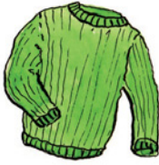
der Pullover Pul-lo-ver Nomen <Pullover>