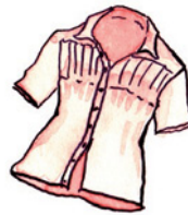
die Bluse Blu-se Nomen <Blusen>