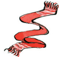
der Schal Schal Nomen <Schals, Schale>