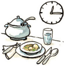
das Mittagessen Mit-tag-es-sen Nomen <Mittagessen>