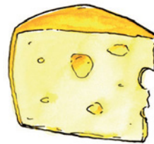
der Käse Kä-se Nomen <Käse>