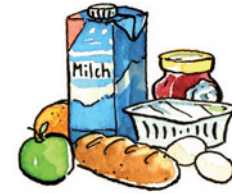
die Lebensmittel Le-bens-mit-tel Nomen Plural