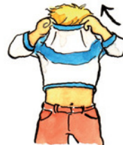
sich ausziehen sich aus|zie-hen (Verb) <zieht sich aus, zog sich aus, hat sich ausgezogen>