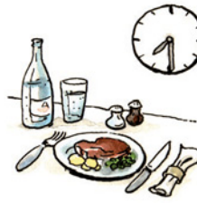
das Abendessen Abend-es-sen Nomen <Abendessen>