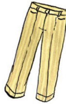
die Hose Ho-se Nomen <Hosen>