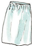
der Unterrock Un-ter-rock (Nomen) <Unterröcke>