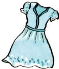
das Kleid Kleid Nomen <Kleider>