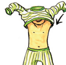
sich anziehen sich an|zie-hen (Verb) <zieht sich an, zog sich an, hat sich angezogen>