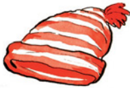
die Mütze Müt-ze Nomen <Mützen>