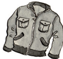
die Jacke Ja-cke Nomen <Jacken>