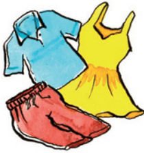
die Kleidung Klei-dung Nomen