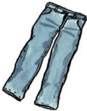
die Jeans Jeans Nomen <Jeans>