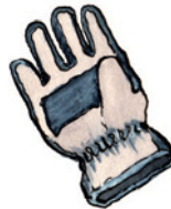
der Handschuh Hand-schuh Nomen <Handschuhe>