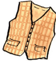
die Weste Wes-te Nomen <Westen>