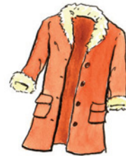
der Mantel Man-tel Nomen <Mäntel>