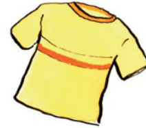
das T-Shirt T-Shirt Nomen <T-Shirts>