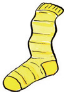
der Strumpf Strumpf (Nomen) <Strümpfe>