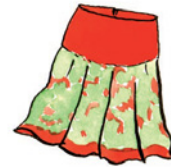
der Rock Rock Nomen <Röcke>