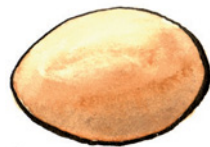
das Ei Ei Nomen <Eier>