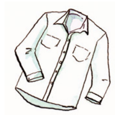
das Hemd Hemd Nomen <Hemden>