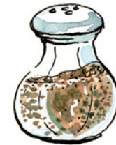
der Pfeffer Pfef-fer Nomen