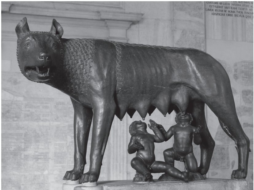
Kapitolinische Wölfin, Datierung umstritten, vermutlich frühmittelalterlich