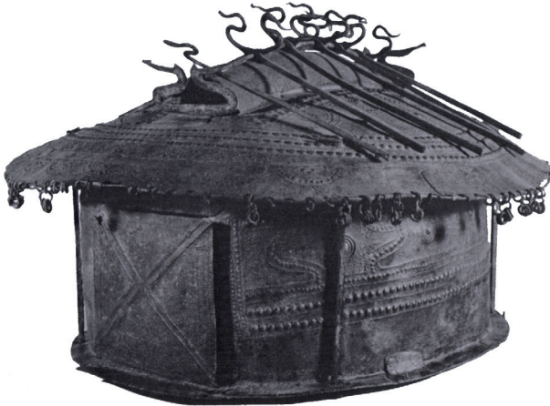
Urne in Hüttenform, vermutlich aus Vulci, Museo Nazionale di Villa Giulia, 7. Jh. v. Chr.