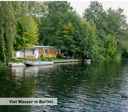
Viel Wasser in Berlin!

Aufgrund der historischen Entwicklung, vor allem aber der früheren Teilung, ist es heute schwierig in Berlin ein einziges Zentrum als Innenstadt festzulegen. Die Sehenswürdigkeiten und