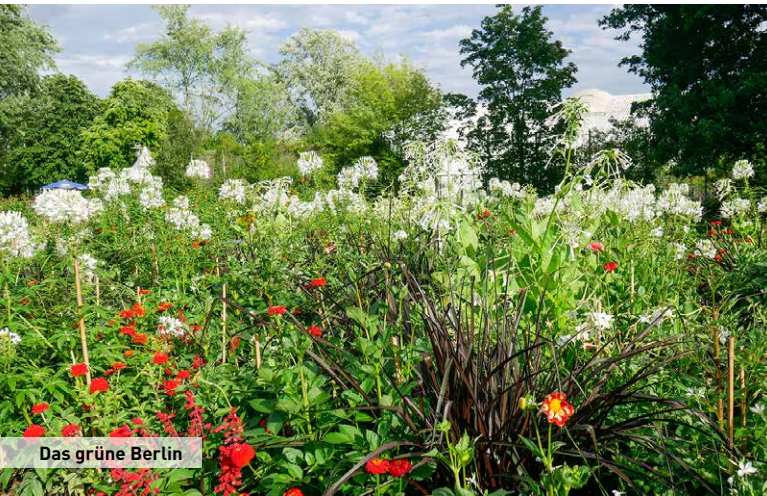
Das grüne Berlin

Berlin ist überraschend und großartig, so viel kann ich ihnen als Autor dieses Buches versprechen. Doch die Stadt ist nicht nur großartig, sondern auch ziemlich groß. Wer hätte gedacht, dass man Manhattan fünfzehnmal in Berlin unterbringen könnte? Würde man die 3,7 Millionen Einwohner Berlins gleichmäßig über die Stadt verteilen, fielen auf jeden Bewohner der Stadt immerhin noch 250 Quadratmeter. Bei solch einer Verteilung würden sich dann übrigens ein Drittel aller Berliner im Wald oder im Grünen befinden. Denn die deutsche Hauptstadt ist eine der grünen Städte Europas. Um sich den Reichtum an Stadtbäumen bildlich besser vorzustellen, hat eine Tageszeitung in Berlin errechnet, dass die Waldfläche der Stadt 40.000 Fußballfelder füllen würde. So richtig im grünen Bereich ist die Stadt aber, wenn man bedenkt, dass zu all den Wäldern noch mehr als 2500 Parks und Gärten hinzukommen.