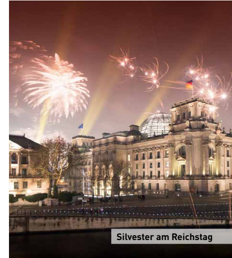
Silvester am Reichstag

Berlin ist international. Mittlerweile leben Menschen aus über 170 Ländern in der Stadt. Die multikulturelle Vielfalt Berlins zeigt sich besonders beim Karneval der Kulturen, der jedes Jahr um Pfingsten herum in Kreuzberg über eine Million tanzende Menschen auf die Straßen bringt. Bei Umfragen die Lebensqualität betreffend landet die deutsche Hauptstadt im weltweiten Vergleich regelmäßig unter den Top 13 (aktuelle Mercer-Umfrage).