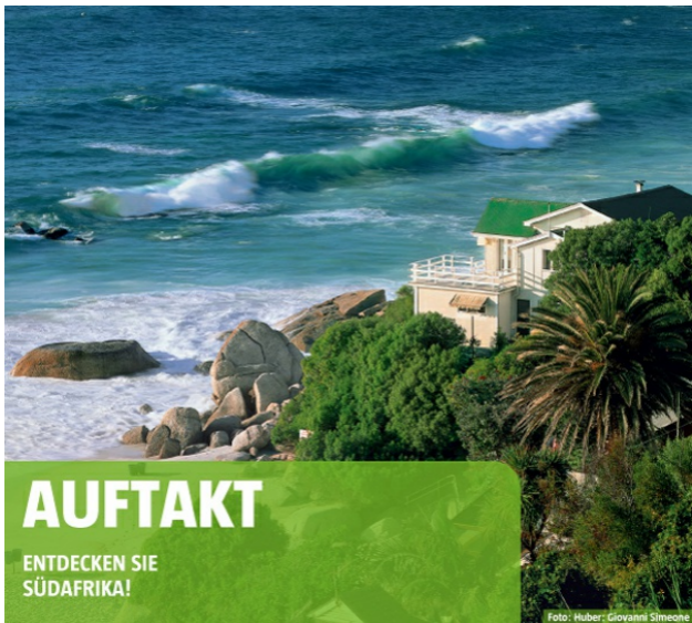
Bild: Strand am Westkap

Südafrika ist ein Reiseland, das Besuchern Vieles bietet: Spaziergänge an den endlosen Stränden des Indischen Ozeans oder Wanderungen an der Küste der Garden Route,