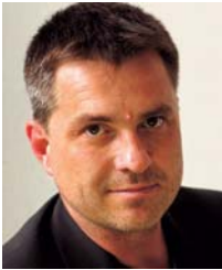
Für den Fotografen Peter Hirth war die Eifel absolutes Neuland. Und insofern war er zunächst skeptisch bei Übernahme des Auftrags. Doch heute ist er von dem geheimnisvollen Bergland fasziniert.