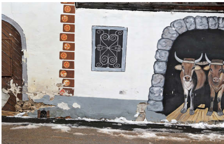
Graffiti auf ländliche Art und schon etwas in die Jahre gekommen: Wo kein Vieh mehr im Stall steht, wird es auf die Fassade gezaubert ...