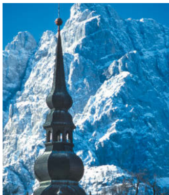
Hoch hinaus wollen beide, Berg und Kirchturm.

Die meiste Zeit des Jahres geht es ruhig und beschaulich zu, nur in den Sommer- und Winterferien steigt der Geräuschpegel, dann verwandelt sich die 5200-Einwohner-Stadt in einen typischen Touristenort. Unterkünfte und Restaurants gibt es in Hülle und Fülle, dazu können Sie unter vielen Outdoor-Angeboten wählen. Erwarten Sie in Kranjska Gora keine kulturellen Highlights. Immerhin hat sich das Zentrum mit seinen im Alpinstil erbauten Häusern einen gewissen Charme bewahrt. Schön anzuschauen ist die Kirche der Jungfrau Mariä Himmelfahrt , die im Jahr 1510 erbaut und später barockisiert wurde. Ihre Fassade