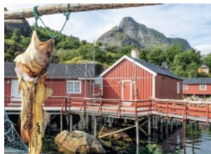
Schön alt sind Fischerdörfer wie Nusfjord auf Flakstadøya (Lofoten).