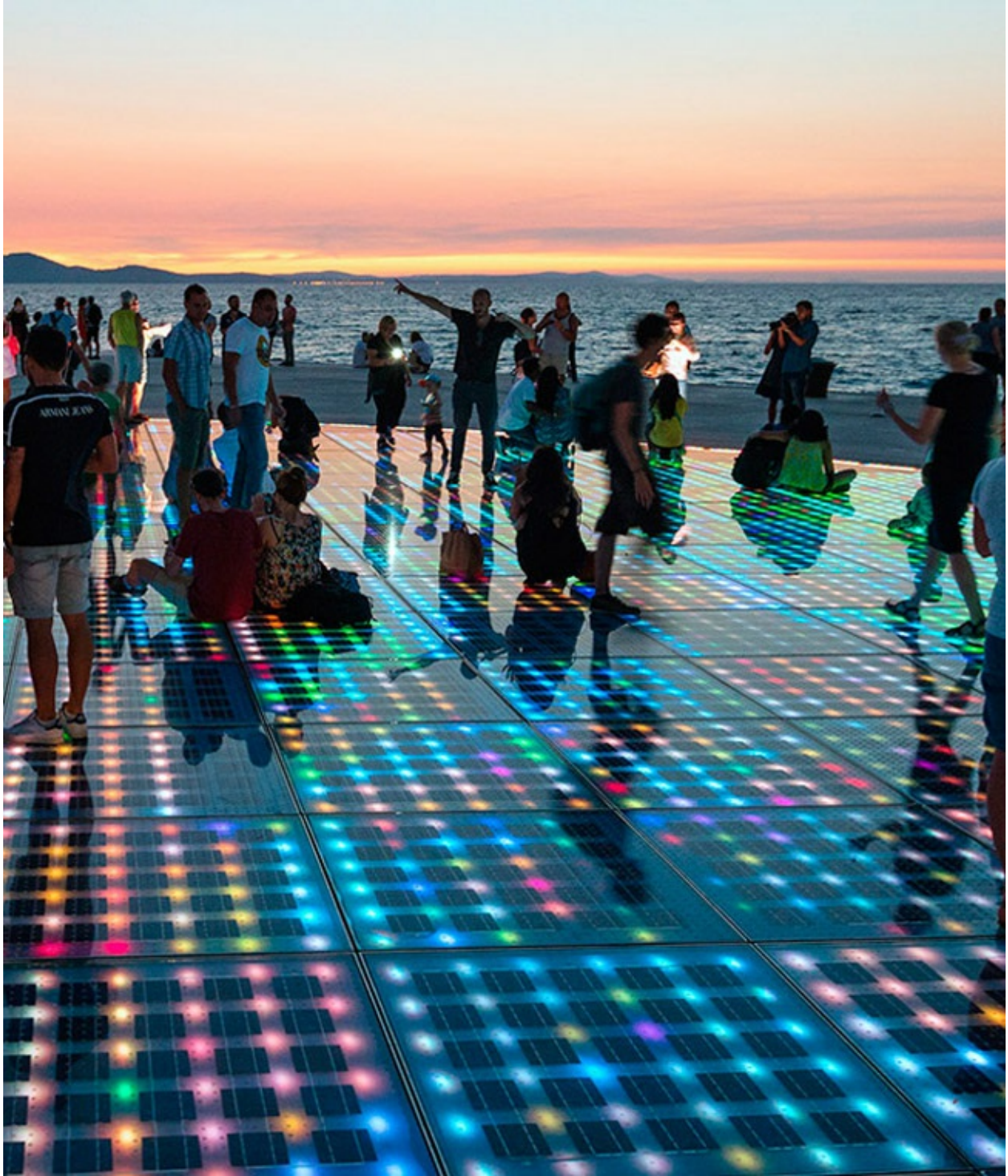
Gruß an die Sonne