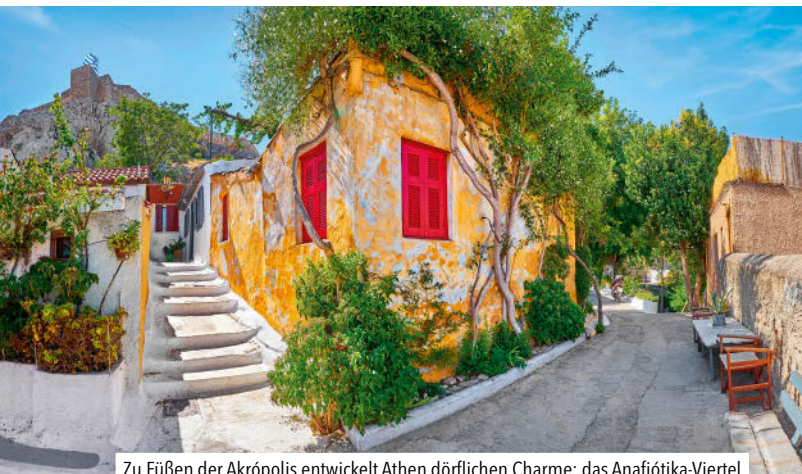
Zu Füßen der Akropolis entwickelt Athen dörflichen Charme: das Anafiótika-Viertel

chen. Diese vielen historischen Bauten stehen nicht isoliert wie deplatzierte Relikte aus längst vergangenen Zeiten im Straßenbild, sondern sind ins Alltagsleben eingebunden. In keiner anderen Großstadt Europas ist die Antike noch so präsent wie hier, Rom ausgenommen. Doch in Rom künden Bauwerke von der Großmannssucht der Kaiser, in Athen sind sie größtenteils eindrucksvolle Zeugnisse des ersten demokratischen Staats der Geschichte. Hier wurde zuerst gebaut und gedacht, was die Römer später nachahmten, technisch verbesserten und schließlich – wie das Theater mit der Tierhatz und den Gladiatorenkämpfen oder die Tempel zur Kaiserverehrung – entwürdigten und entweihten. Zum besonderen Flair der Athener Innenstadt tragen auch andere, an die Pláka angrenzende Stadtviertel bei, die noch bis vor wenigen Jahrzehnten reine Industrie- und Gewerbeviertel waren. Im Thissío-Viertel trifft sich die Jugend bei Rockmusik in den ehemaligen königlichen Pferdeställen, zeigt eine Galerie moderne Kunst in den Räumen einer einstigen Hutfabrik. Im Psirrí-Viertel werden heute noch tagsüber in vielen kleinen Werkstätten Schuhe, Taschen und andere Lederwaren genäht, während abends die Tavernen, Bars und Musiklokale überwiegend junge Leute aus der ganzen Stadt anziehen. Sogar der alte Gasometer im Gázi-Viertel hat eine neue Verwendung als Kunstgalerie gefunden, um die herum Bars und Restaurants auch wohlhabende Gäste in Feinschmeckerrestaurants locken.