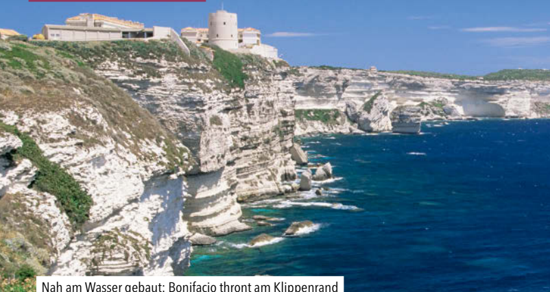
Nah am Wasser gebaut: Bonifacio thron am Klippenrand

Kalliste! Die Schönste! Für die namensgebenden Griechen war dies schon in der Antike klar. Sizilien, Sardinien und Zypern schlagen Korsika zwar bei der Größe, doch keine der Konkurrentinnen vereint auf 9000 km 2 so abwechslungsreiche Landschaften, kulturelle Highlights, charmante Dörfer und Städte – und mediterrane Lebenslust.