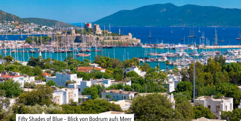
Fifty Shades of Blue – Blick von Bodrum aufs Meer

Um mit dem griechischen Historiker Herodot zu sprechen: Die Ägäis hat „den schönsten Himmel und das beste Klima“ der Welt. Ein vom Wind zerzauster einsamer Norden, die betriebsame, quirilige Mitte rund um İzmir und das mondäne Bodrum im Süden, das sind die groben Orientierungsmarken. Die vorgelagerten griechischen und türkischen Inseln garantieren reizvolle Entdeckungen.