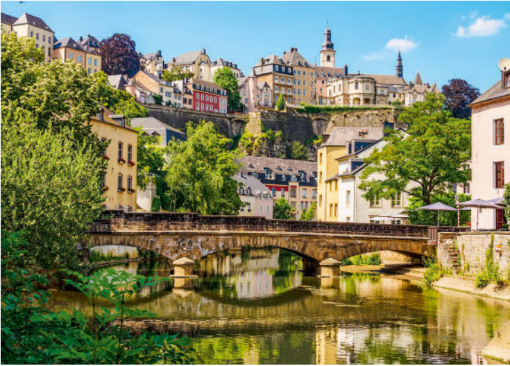
Altstadt und Grund spiegeln sich im Wasser der Pétruusse fast schon märchenhaft.

jährlichen Wallfahrtszeit ›Octave‹ (3.–5. So nach Ostern) pilgern Scharen von Gläubigen zum Gnadenbild, das dann in besonders festliche Gewänder gehüllt ist. Beispielsweise in grüne Samtkleider, ein Geschenk von Kaiserin Maria Theresia. Die kunstvoll gestalteten Glasfenster der Fürstenloge zeigen u. a. den Stadtgründer Graf Siegfried und König Johann den Blinden, dessen imposantes, von einer Figurengruppe beweinete Grabmal im Vorraum zur Krypta steht. In der befindet sich, bewacht von majestätischen Bronzelöwen, die Gruft der großherzoglichen Familie.