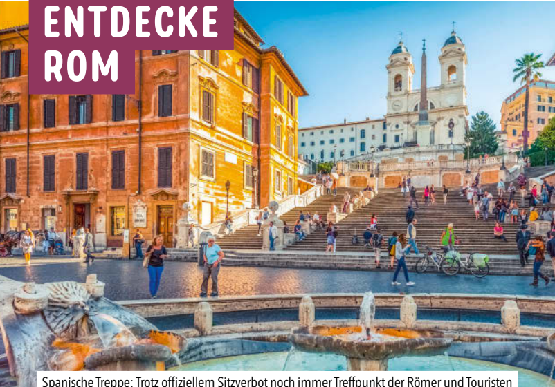
Spanische Treppe: Trotz offiziellem Sitzverbot noch immer Treffpunkt der Römer und Touristen

Ganz großes Kino! Du steigst aus dem dunklen, leicht schäbigen Schacht der Metrostation Linie B die Treppen hoch, drängst dich durchs Drehkreuz hinaus ins gleißende Tageslicht, und da liegt es plötzlich vor dir: das Kolosseum. Zum Anfassen! Auch wenn Geschichte nicht gerade dein Lieblingsfach war, die steinerne Präsenz des fast 2000 Jahre alten Amphitheaters, wo Tausende Gladiatoren und wilde Tiere auf ein Handzeichen des römischen Kaisers blutig niedergemetzelt wurden, lässt einen auch heute noch schauern.