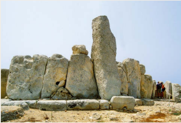
Für die Ewigkeit gebaut: Ħaġar Qim, eine der bedeutendsten Tempelanlagen Maltas

gna Mater, der Großen Mutter. Sie waren unterteilt in heilige und öffentliche Bereiche. Den Tempeldienst mit Rauch- und Trankopfern versahen Priesterinnen. Es gab Orakelkammern, welche die Priesterinnen von außen betreten konnten. Durch ein Loch in der Wand sprachen sie zu den Menschen, die im Tempelinneren auf die Orakel der Gottheit warteten. Zwar wurden in den Tempeln auch Tiere geopfert, aber da die Archäologen weder Waffen noch Spuren von Gewalteinwirkung fanden, dürfte es sich um eine friedfertige Zivilisation gehandelt haben.