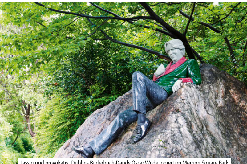
Lässig und provokativ: Dublins Bilderbuch-Dandy Oscar Wilde logiert im Merrion Square Park

men, die Menschen zogen weg. Nun legte man eine Uferpromenade an und baute einen hölzernen Walkway über den Fluss, zum Nationalfeiertag am 17. März wird auf der Liffey ein Feuerwerk abgebrannt. Und im Hafen entstanden im Rahmen des größten Entwicklungsplans in der irischen Geschichte Wohnungen, Hotels, Parks, ein Konferenzkomplex und ein Einkaufszentrum – die Docklands.