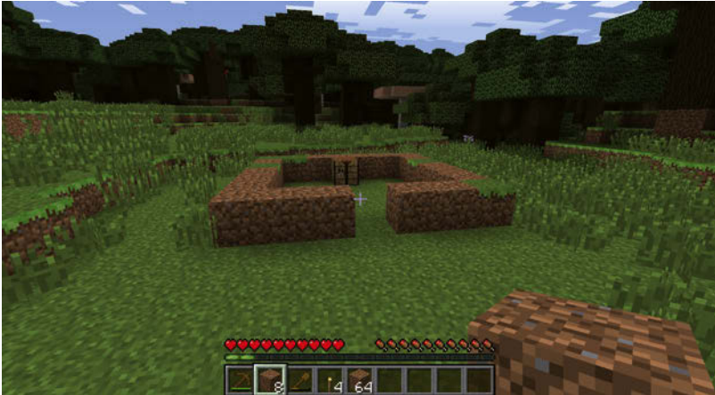
Abbildung 1.11: Grundriss eines einfachen 7x7-Hauses

cken ausreichend. Abbildung 1.11 zeigt den Grundriss des Hauses. Die Freistelle an der Vorderseite solltest du nicht vergessen, da die Tür hier später ihren Platz findet.