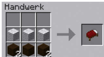
Abbildung 1.16: Produktion eines Bettes

Sind alle Rohstoffe gesammelt, kannst du sie mit der Werkbank zu einem Bett verarbeiten, Abbildung 1.16 zeigt die dafür nötige Anordnung.