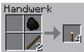
Abbildung 1.10: Fackel-Rezept

Mit der so gewonnenen Kohle und den bereits vorhandenen Stöcken kannst du nun, im Inventar oder an der Werkbank, Fackeln herstellen, die später dein Haus erleuchten und Monster in der Nacht fernhalten können. Das Rezept dazu zeigt Abbildung 1.10.