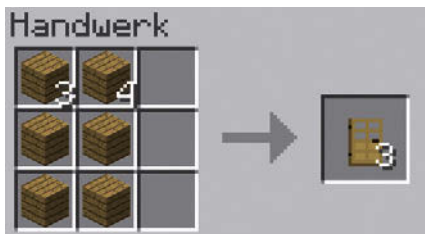
Abbildung 1.13: Tür-Rezept

Um in der Nacht wirklich sicher zu sein, fehlt nun nur noch eine Tür. Mit den verbliebenen Brettern und der Werkbank lässt sich, wie in Abbildung 1.13 gezeigt, eine Tür schnell produzieren.