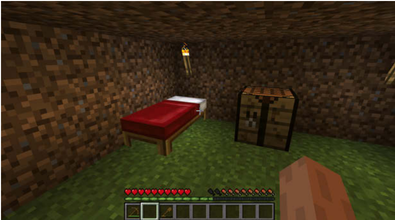
Abbildung 1.17: Platziertes Bett

hast du jetzt aber auch redlich verdient. Du hast deinen ersten Tag in der Welt von Minecraft bravourös gemeistert und dir eine gute Grundlage geschaffen, auf der du aufbauen kannst, egal ob als Krieger, Baumeister oder Entdecker, die Welt steht dir offen. In diesem Sinne: eine gute Nacht!