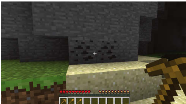
Abbildung 1.9: Überirdisches Vorkommen von Steinkohle an einem Berghang

Mit der so gewonnenen Kohle und den bereits vorhandenen Stöcken kannst du nun, im Inventar oder an der Werkbank, Fackeln herstellen, die später dein Haus erleuchten und Monster in der Nacht fernhalten können. Das Rezept dazu zeigt Abbildung 1.10.