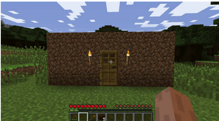
Abbildung 1.14: Fertiges Gebäude

Die Tür muss nun nur noch an der richtigen Stelle positioniert werden. Die beiden übrigen Fackeln können noch außen am Haus neben der Tür platziert werden, das sieht nicht nur gut aus, sondern hilft auch, die eigene Behausung wiederzufinden, sollte man nachts einen Spaziergang unternehmen. Abbildung 1.14 zeigt das fertige Gebäude.