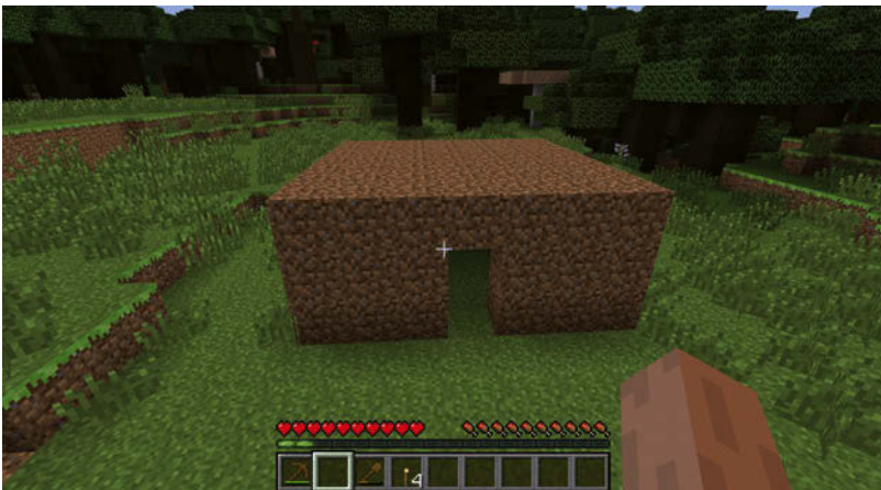
Abbildung 1.12: Fertiges 7x7-Erdhaus

Ist der Grundriss erst einmal fertig, müssen nur noch zwei weitere Reihen Erde und ein Dach darauf gesetzt werden. Der fertige Bau ist in Abbildung 1.12 zu sehen, nicht unbedingt ein echtes Schmuckstück, aber für die erste Nacht durchaus funktional und ausreichend.