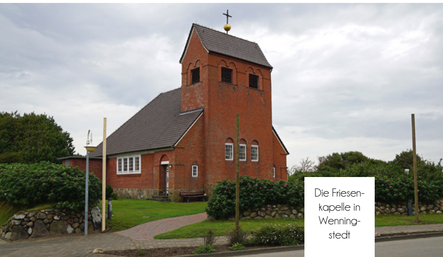
Die Friesenkapelle in Wenningstedt

Die Friesenkapelle in Wenningstedt zählt zu den jüngsten Kirchen auf Sylt. Im Kriegsjahr 1914 wurde der Grundstein für das Gotteshaus gelegt. Vorab war es für die Einwohner recht beschwerlich, den Gottesdienst zu besuchen. Sie mussten sich in das acht Kilometer entfernte Keitum aufmachen. Die kleine Kapelle, unweit