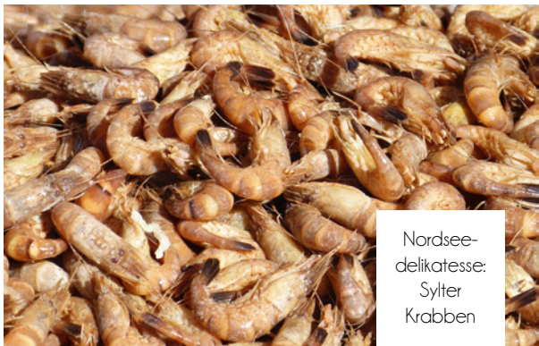
Nordsee- delikatesse: Sylter Krabben

Der Hörnumer Hafen ist als stimmungsvoller Inselmittelpunkt immer einen Besuch wert. Hier können die Schiffe bestiegen werden, welche Touristen zu den Halligen bringen und zur Beobachtung der Robben vor der Küste einladen. Am ersten Augustwochenende verwandelt sich das Hafengelände in eine bunte Flaniermeile. Geboten wird ein buntes Programm für Jung und Alt. Maritimes steht im Vordergrund. Die Gäste können verschiedene vor Anker liegende Schiffe besichtigen und mehr über die Arbeit der Wasserschutzpolizei erfahren. Für Romantiker sind die Ausflüge mit den historischen Segelschiffen ein bleibendes Erlebnis. Die Sylter Surfschule lädt ein, Bekanntschaft mit dem Brettern, die für viele die Welt bedeuten zu schließen. Zu einer schönen Tradition geworden ist der alljährliche