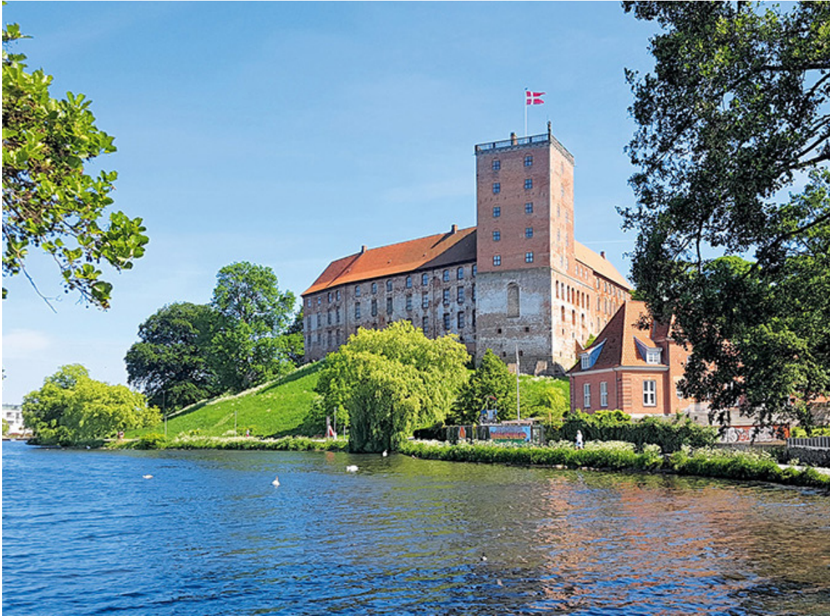
Ein Stück dänische Geschichte erzählt das Schloss in Kolding.