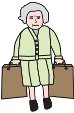
to carry bags