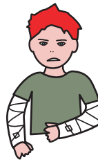
to wash his hair