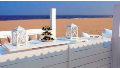
0.08dth Abb.: zam

Blick auf die Segel- und Fischerboote. Auch für jeden Geldbeutel ist etwas dabei – und sei es die Pommesbude, die auch gebackenen Fisch anbietet und äußerst beliebt ist. Mit vollem Bauch kann man sich nun entweder an den Strand legen oder die Strandpromenade in nördlicher Richtung