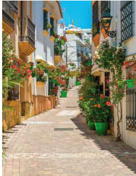
☞ In den Gassen von Estepona