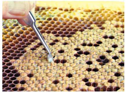
Befall Arbeiterinnenbrut: Puppen untersuchen.