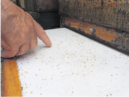
Natürlicher Milbenabfall: Milben zählen.