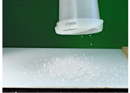
Befall Arbeitsbienen: Puderzucker Methode.